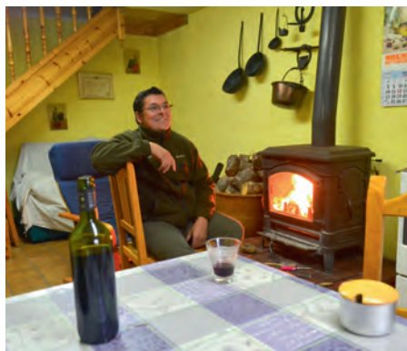
Jó hangulatban várakozunk