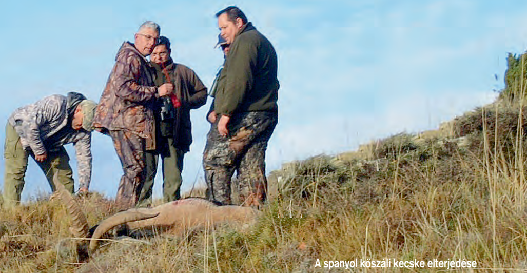
A spanyol kőszáli kecske elterjedése

A kecskevadászat előtt azonban az egyik leghíresebb spanyol vadászat, a páratlan han-